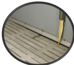
2. Vide sous les cloisons recouvert d'une cornière en inox