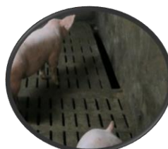
4. Fente en fond de case