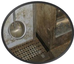
1. Vide sous le nourrisseur ou dispositif pour le démonter / retourner