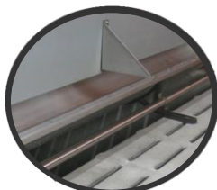
3. Vide sous une auge inox